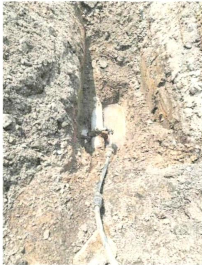
■吉隆坡一个建筑工地涉及非法接驳水管，遭有关当局取缔。