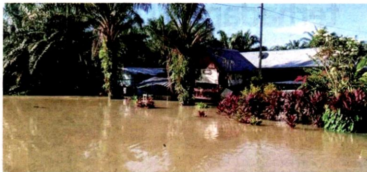
Rumah penduduk dinalki air dalam kejadian banjir yang melanda beberapa kawasan di Kuala Selangor sejak Sabtu.

Menurutnya, PPS SK Parit Mahang pula dibuka pada Isnin sehingga kini