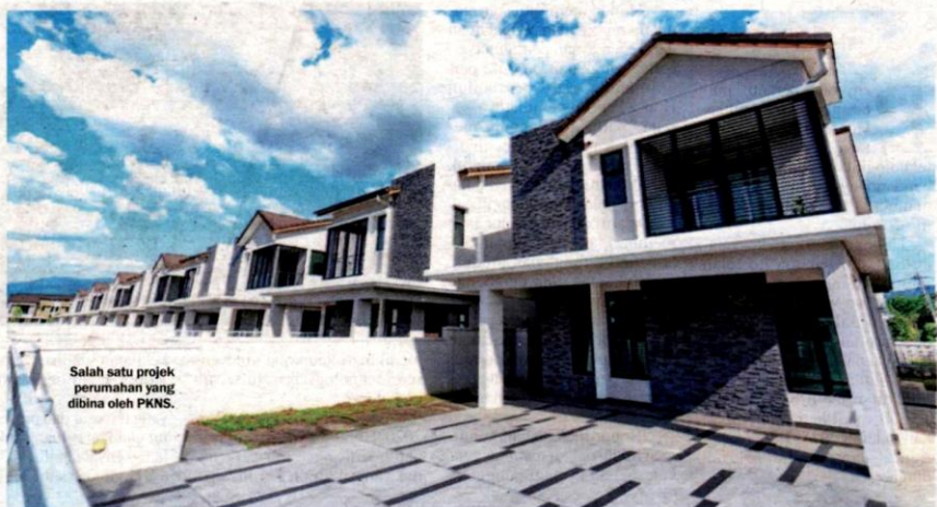
Salah satu projek perumahan yang dibina oleh PKNS.

"Selain itu, faktor sokongan lain seperti Kadar Dasar Semalaman (OPR) yang rendah, pengecualian duti setem dan diskaun sehingga 20-peratus juga turut menyumbang kepada kejayaan kempen ini," katanya dalam satu kenyataan.