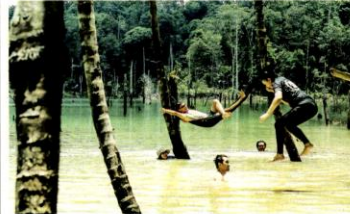
LOKASI LOKASI riasah di dalam hutan kini menjadi salah satu pilihan kepada orang ramai terutama pada hujung minggu dan cuti umum.

Malim gunung hutan Di Sabah, malim gunung disediakan untuk mereka yang mahu mendaki Gunung Kinabalu. Mereka membawa makanan, minuman dan barangan keperluan lain untuk pendaki selain menjadi penyediaan jika ada yang sakit atau cedera. Kami mahu memperkemaskan khidmat malim gunung perhutanan sejak dua, tiga tahun lalu di kawasan-kawasan beradab seperti Hutan Simpan Kelat Perak, Perungguan dan Gunung Korbi, Perak. Jabatan Perhutanan Sememangut Malaysia menggarutkan Kurus Malim Gunung Perhutanan yang pertama di Batu Pahat, Johor pada September 2020 diwartakan 60 orang. Mereka dipaparkan sebagai malim gunung perhutanan, menyempatkan dan bertunas keemasan. Kurus adalah perniagaan dan dibenarkan api. Ada 24 set kurus di seluruh Sememangut terbagi buat masa ini diwartakan berikutan Perintah Kawalan Pergerakan (PKP). Peraturan bagi kawasan ini diwartakan di bawah Tabung Covid-19 oleh Kementerian Kewangan. Selepas ini kita akan melancarkan syarat bagi menggunakan khidmat malim gunung perhutanan kepada para pendaki yang ingin melakukan aktiviti pendidikan di kawasan gunung yang telah dibenarkan pasti oleh jabatan ini.