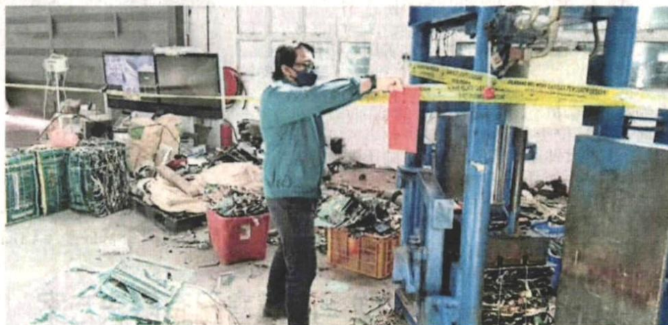
■执法人员机场查封非法处理电子垃圾的建筑物。

他说，根据初步调查，怀疑这些电子垃圾是非法从外国入口，当局已援引1974年环境素质法令第34B条文和第18 (1) 条文开档调查。