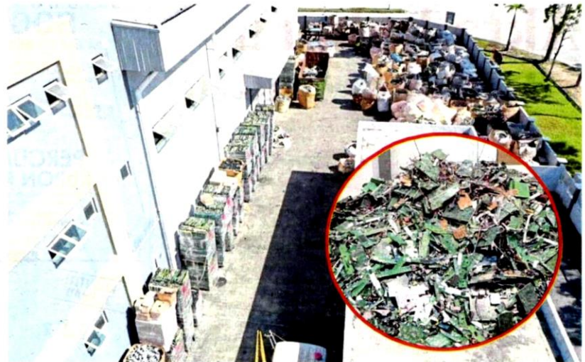
JAS Selangor ditemui 200 tan sisa buangan elektrik dan elektronik menerusi serbuan di sebuah bangunan kilang di kawasan perindustrian Sungai Puloh, kelmarin.

"Menerusi serbuan itu, dianggarkan 200 beg mengandungi pelbagai jenis buangan elektrik dan elektronik seperti papan litar bercetak dan kabel wayar kuprum yang dikategorikan mengi-