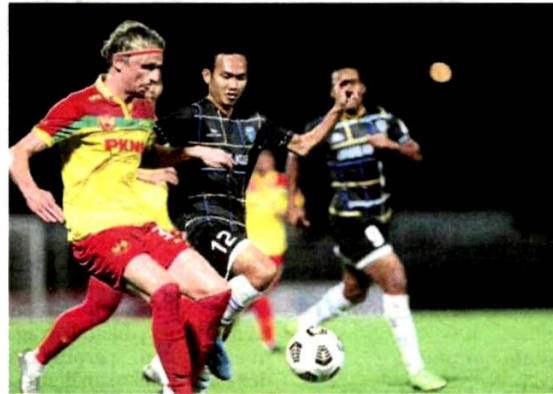
HEUBACH (kiri) dijangka kembali membarisi kesebelasan utama skuad Red Giants.