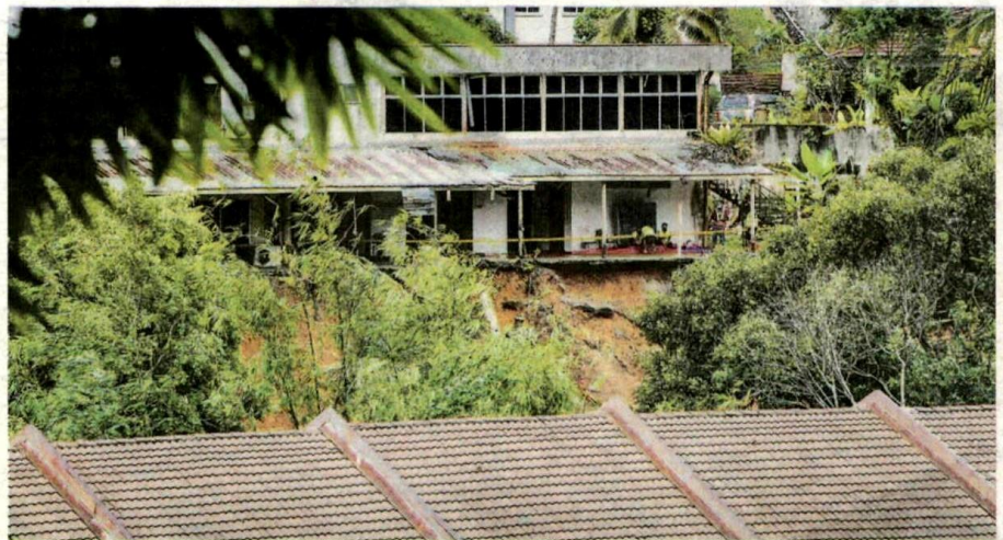
KEADAAN beberapa kediaman penduduk yang terlibat dalam kejadian tanah runtuh di Jalan Kemensah Heights, Ampang Jaya, baru-baru ini.

“Sehingga kini, mereka masih tidak dibenarkan pulang, namun, penghuni boleh balik ke rumah untuk mengambil barang-barang mereka atas pengawasan polis buat sementara