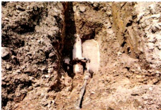
SAMBUNGAN paip yang ditemui ketika operasi di Kuala Lumpur kelmarin.

Orang ramai yang mempunyai maklumat boleh menghubungi talian 013-3885 000 atau e-mel ke aduan@span.gov.my .