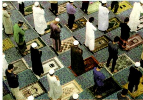
HANYA individu lengkap vaksinasi dibenarkan berjemaah di masjid, surau pada setiap waktu solat. – GAMBAR HIASAN

"SOP seperti sudah mengambil dua dos vaksin, memakai pelitup separa muka dan menjaga penjarakan fizikal perlu dipatuhi.