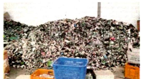
Kegiatan pemprosesan sisa buangan elektrik dan elektronik secara haram.