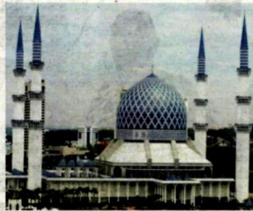
Seramai 1,000 jemaah dibenarkan solat Jumaat di Masjid Salahuddin Abdul Aziz Shah.

"Bagi surau yang mendapat kebenaran solat Jumaat, seramai