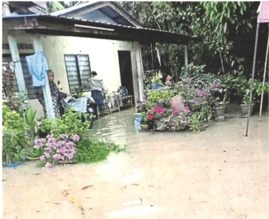
居民住家淹水。

(吉隆坡22日訊)瓜雪多個地區于上周六一場暴雨時發生水災，201名居民受災情影響。