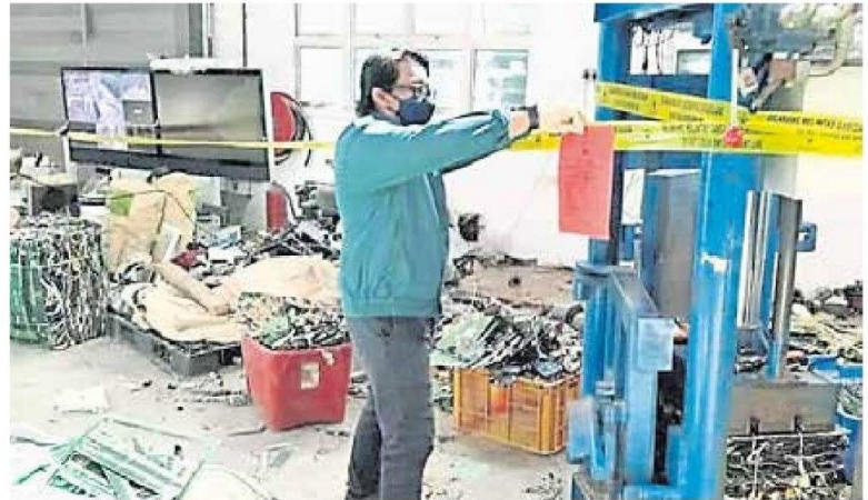
■非法电子废料厂，遭环境局执法人员被查封。

(巴生22日讯) 巴生一间非法运作的电子废料厂，遭雪州环境局执法人员发现，厂内有200多袋重达20万公斤疑非法进口我国的电子废料，因此为了停止一切的污染行为，执法队指令该厂立刻停运和被查封。