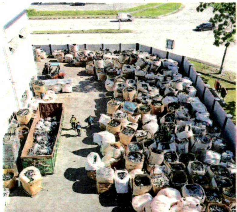
SEBAHAGIAN beg yang berisi bahan buangan elektrik dan elektronik yang ditemui di sebuah premis di Klang kelmarin.

Menurutnya, tindakan menahan operasi kelengkapan proses