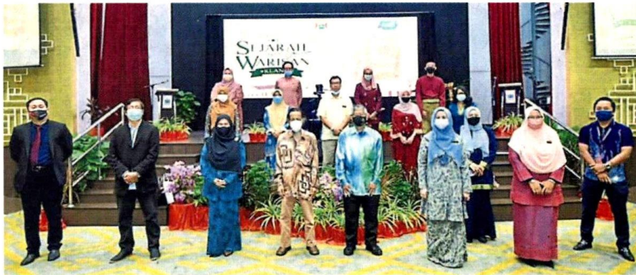
巴生市议会举办研讨会，进一步朝“皇家遗址城”目标迈进。