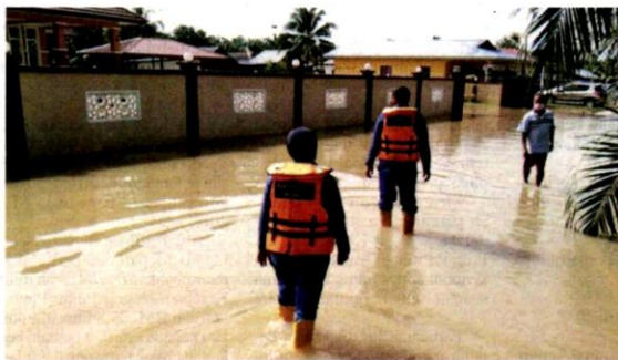
Beberapa kawasan rumah penduduk yang dinalki air.

"Semua agensi yang terlibat juga sentiasa memastikan mangsa dan petugas mengikut prosedur operasi standard (SOP) yang berkuat kuasa dalam menguruskan bencana ini," kata beliau.