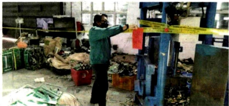
Tindakan serta-merta bagi menghentikan pencemaran telah diambil di bawah peruntukan Seksyen 38(1)(a) Akta Kualiti Alam Sekeliling 1974.

Menurut hantaran tersebut, mereka turut menemui beberapa pekerja warga asing sedang meleraikan