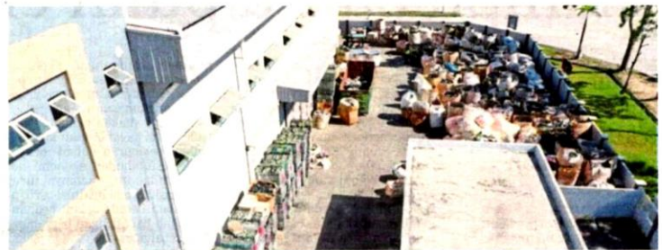
JAS Selangor menemui 200 tan sisa buangan elektrik dan elektronik dalam serbuan di sebuah bangunan kilang di Kawasan Perindustrian Sungai Puloh, Klang, semalam.

"Kertas siasatan sudah dibuka untuk tindakan pendakwaan mengikut Seksyen 34B, Seksyen 19 dan Seksyen 18(1) akta yang sama," katanya.